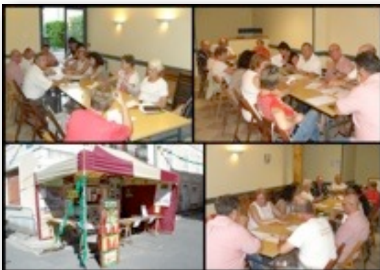
Réunion des présidents d'associations Lisloises