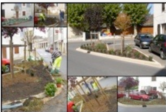
Jardin Place de la Charbonnière