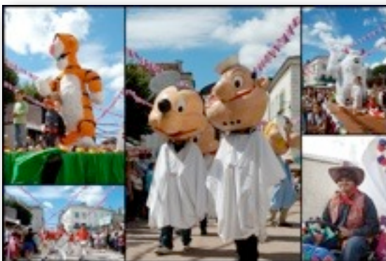
Fête de la St Roch