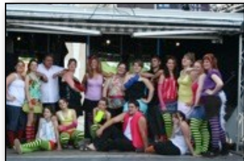
Fête de la musique à Paussac "Les Petites Frippouilles"