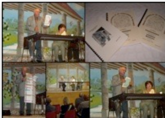
Présentation du Cercle de Généalogie