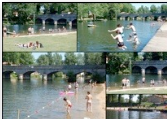
La baignade surveillée