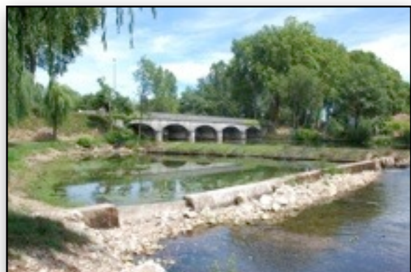
La sécheresse : la Dronne a connu un niveau très bas en 2011