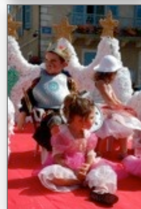
Images de la Fête de la St Roch 2011