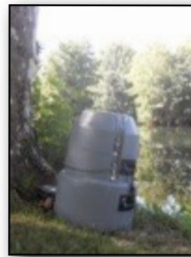
Sondage de la qualité de l'eau de la Dronne et du Bullidour