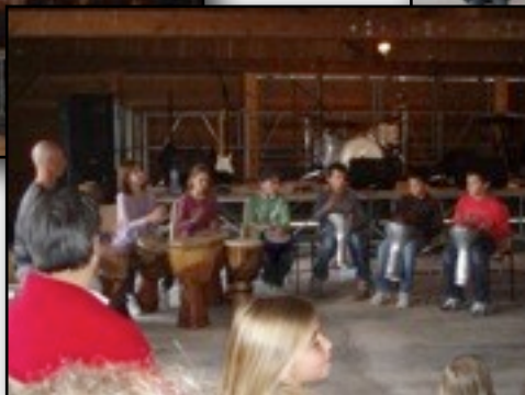
Musique en Fête en Val de Dronne à Celles le samedi 18 juin