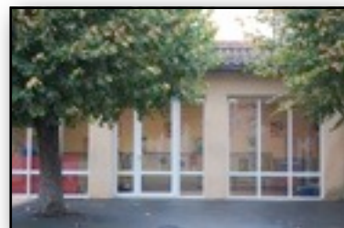
Menuiseries de l'école maternelle