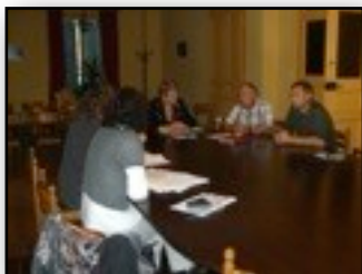
Visite de la Députée Colette Langlade