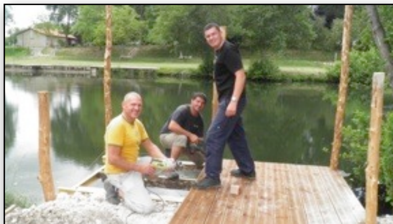
Le ponton des pêcheurs en construction

Un site internet va être publié dans les jours à venir sous le nom : « Le roseau Lislois, AAPPMA de Lisle »