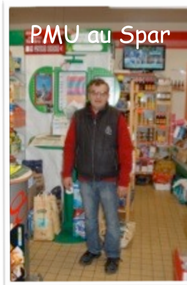
Le PMU se situe maintenant chez Laurent au Spar