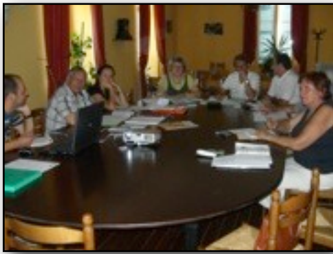
Révision PLU : réunion de travail avec les personnes publiques associées