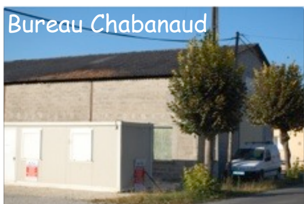
Bureau temporaire de l'entreprise Chabanaud, rte de Tocane