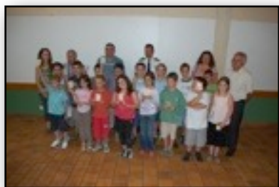
Remise des permis piétons