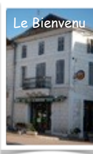
Le Bienvenu - réouverture prochaine...

Le saviez-vous...il y a plus de 9000 mots et presque 80 images dans l'édition de votre bulletin municipal ! 500 exemplaires sont distribués dans les boîtes aux lettres. Réalisé par Susie Heselton, Michèle Dudon, Flore Allard et Joël Constant