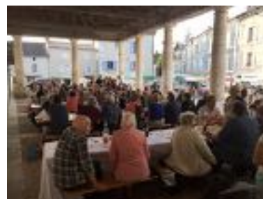
Les marchés festifs