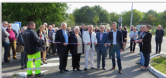
L'inauguration, le 23 septembre, de la déchetterie de Tocane St Apre suite à un « complet relouking ».