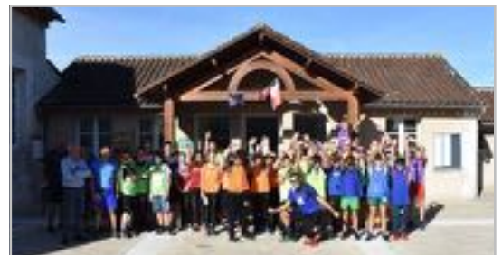
Devant la mairie de St Victor après le RAID Ados. Le RAID était sur 2 jours et une nuit pendant les vacances de Toussaint