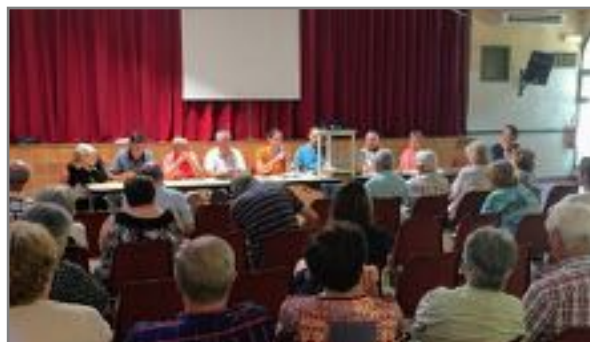
Réunion publique du samedi 17 juin à la salle des fêtes. Thèmes abordés : le SMCTOM et l'Espace de Santé Rural