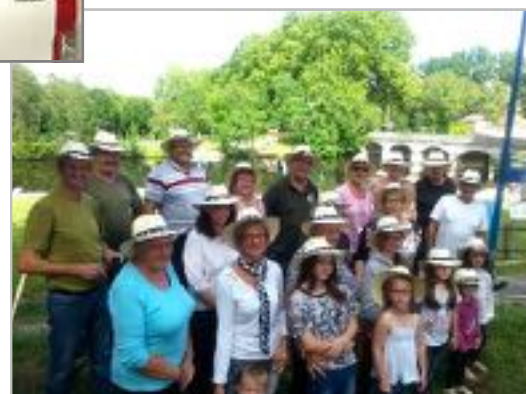
« Fête des chapeaux » à la baignade grâce à France Bleu Périgord et leur jeu de l'été