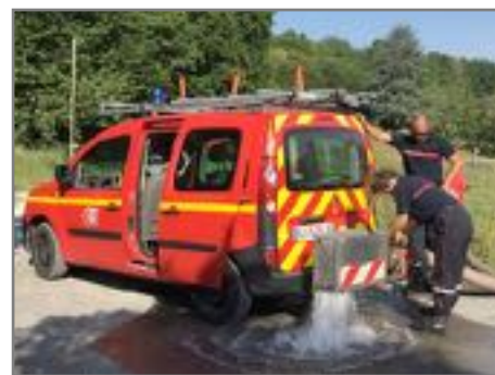
La vérification des bornes incendies par les pompiers