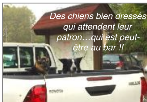
Des chiens bien dressés qui attendent leur patron...qui est peut-être au bar !!