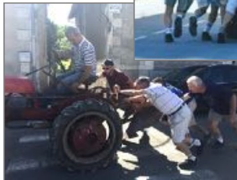
Les vieux « chevaux » du tracteur à Pizza Jo ont besoin des plus jeunes pour les ramener dans le défilé !