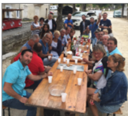
Les forains prennent des forces avant les 4 jours de fête