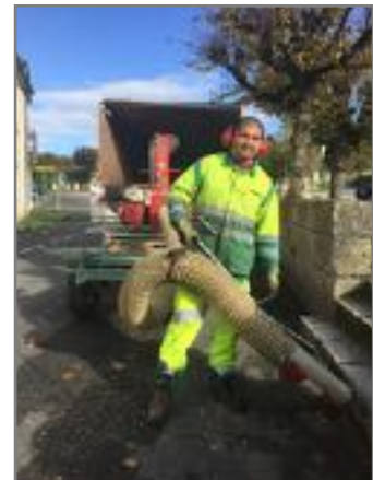
Les agents communaux en plein travail