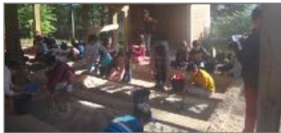
Ci-dessous : le tableau numérique dans la classe de la directrice