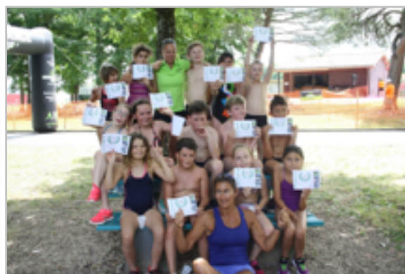
Accompagnement à St Astier des enfants participant au projet triathlon mis en place dans le cadre des TAP de Montagnier, Tocane et Champagne Fontaine