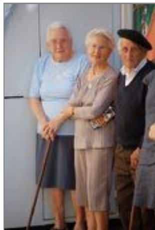
Même pour les plus anciens, la fête reste la fête !

Sainte Elizabeth nous montre quel bonhomme l'hiver sera.