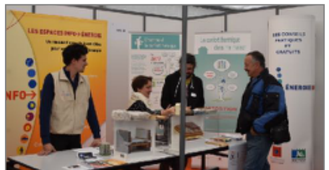
Le Festival des Energies au village de Beauclair à Douchac le 29 et 30 septembre