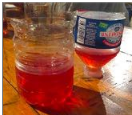
Il n'y a plus de verres ? Pas de problèmes ! On a des idées à Lisle, 2 bons verres avec une seule bouteille !