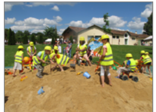
Festidrôle à Villeteureix en mai dernier organisé par le service Enfants-Jeunesse