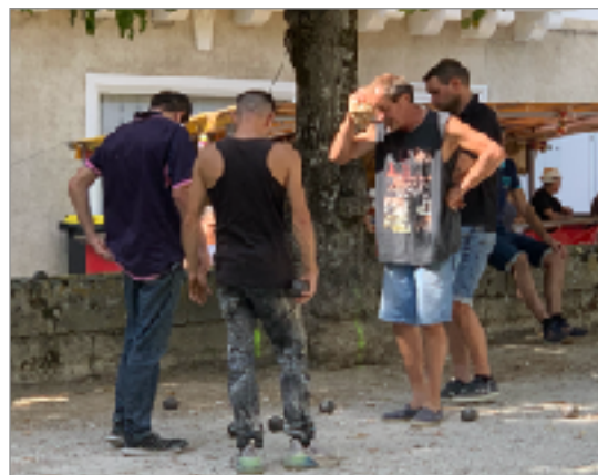
Tu tires ou tu pointes ?!