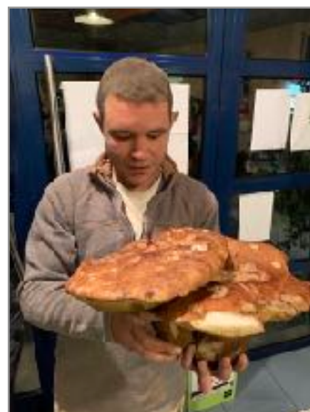
Une belle omelette en perspective