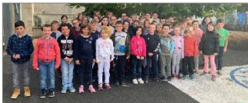
Ci-dessous : les élèves de l'école primaire.