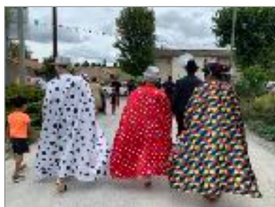
Batman & Robin sont venus à la fête ???