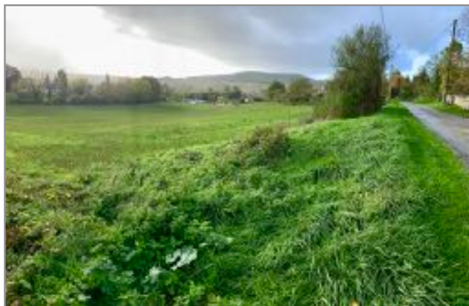
A gauche le terrain situé à la Pierre Plantée, à droite le terrain du Bordiérage. Deux des quatre sites retenus par le bureau d'études pour de futurs lotissements