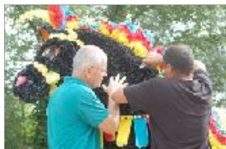
Chirurgie en urgence ! Le cheval a perdu sa tête !!