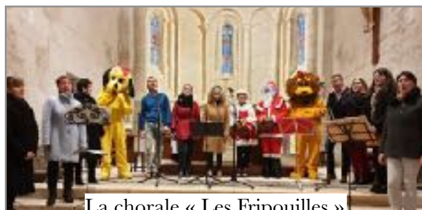
La chorale « Les Fripouilles »

Le marché de Noël sous la halle (et sous la pluie !) le dimanche 8 décembre.