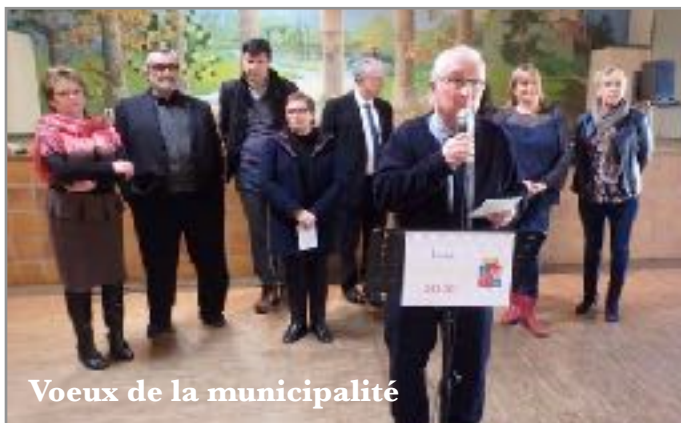
Voeux de la municipalité

vu le jour. Ainsi des familles ont resserré les liens, parfois quelque peu distendus entre leurs membres. Ces moments-là ne peuvent qu'être des moments de rapprochement et de retour des vraies valeurs de la vie. Le plus bel exemple en a été donné par la solidarité entre voisins qui nous a surpris de par son ampleur quand nous avons enquêté et recherché les personnes les plus isolées et les plus vulnérables. A chaque fois ou presque, la réponse était que des voisins s'occupaient d'eux. C'est la confirmation que le milieu rural peut très vite remettre en place des valeurs qu'il a dans ses gènes et que l'on a plus de mal à retrouver en secteur urbain. Merci à vous tous pour cette offre proposée et bien sûr acceptée.