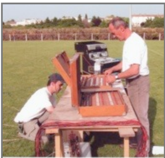
SEGALA Artifices s'installe bientôt sur la Zone d'Activités Economiques des Jonctarias