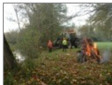
Restauration des berges de la Dronne par le SMEAP