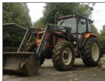
Achat de matériel : tracteur communal