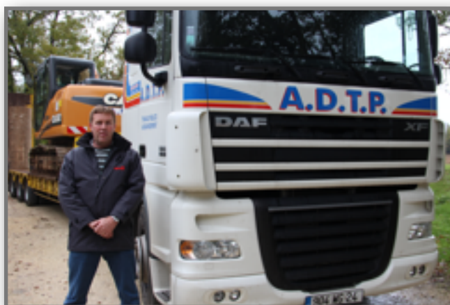
L'entreprise A.D.T.P. se trouve sur la zone d'activités à côté de la Coopérative Agricole