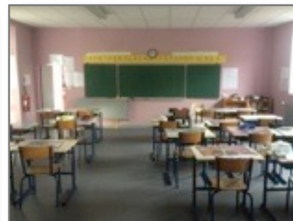
Rénovations dans les salles de l'école primaire